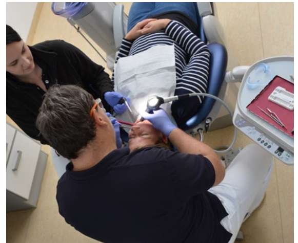
Abb. 6 Alle zahnärztlichen schlauchgebundenen Instrumente in der Rücklehne und das Behandlertray mit der Steuerung der Behandlungseinheit liegen im Greifbereich, sodass sie – ohne die Referenzhaltung zu verlassen – handhabbar sind.