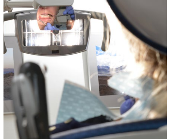
Abb. 8 Mit einem einfachen Spiegel, der klappbar an der Lampe befestigt ist, kann der Patient auf Wunsch an der Behandlung visuell teilhaben. Auch bei einem Beratungsgespräch kann mit dieser einfachen Hilfe sehr viel erreicht werden.