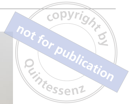
Abb. 9 Patient und Behandler Aug' in Aug' in einer bequemen Sitzposition. Ein partnerschaftliches Arzt-Patienten-Verhältnis kann somit besser erreicht werden.

Die auf die Bedürfnisse des Behandlers abgestimmte Bauweise der zahnärztlichen Einheit ergeben sich folgende Besonderheiten: Die Instrumente, die Steuerung und die Ablagemöglichkeit sind in der Rückenlehne oder dem an der Rückenlehne kardänisch adaptierten Schwebetisch zu finden. Durch eine einfache Bewegung des rechten Unterarms sind sämtliche Arbeitsmittel zugänglich.