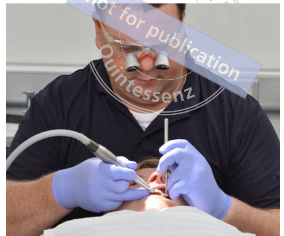
Abb. 4 Arbeiten am Patienten mit Lupenbrille in der Beach'schen Referenzhaltung.