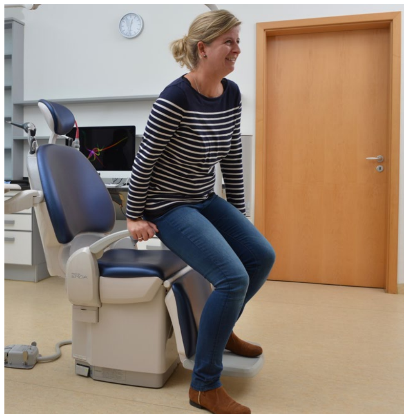
Abb. 22 Den Armlehnen sei Dank ein bequemes Ein- und Absteigen.

Patienten im Rollstuhl haben aufgrund der klappbaren Armlehnen und der aufrechten Einstellung des Behandlungsstuhls keine besonderen Probleme. Die Armlehne wird hochgeklappt, der Rollstuhl parallel neben die Einheit gestellt und der Patient umgesetzt. Eine eventuell notwendige Hilfe durch Begleitpersonen oder Behandler kann sehr rückschonend und