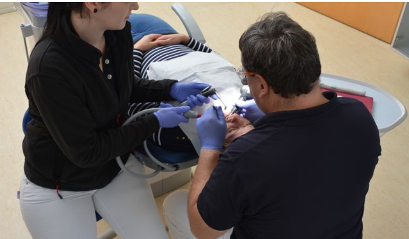
Abb. 5 Mit Assistenz und Lupenbrille in der Beach'schen Referenzhaltung arbeiten.