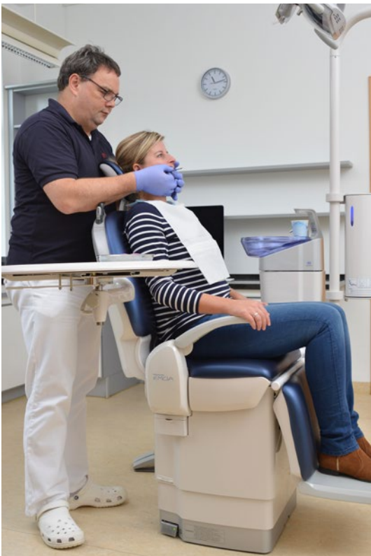
Abb. 14 Nur beim bequem und entspannt sitzenden Patienten können die klinische Untersuchungen des Kiefergelenkes sowie der Kaumuskulatur und perioralen Muskulatur korrekte und reproduzierbare Ergebnisse liefern.