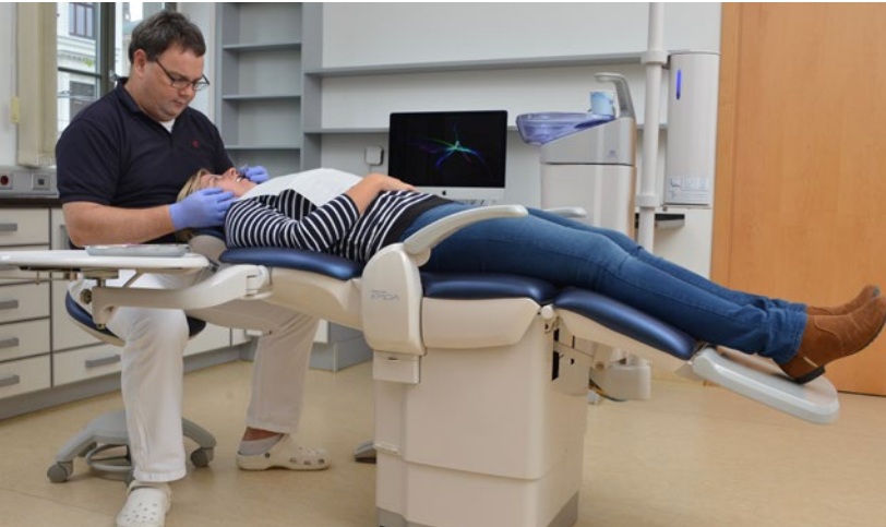
Abb. 3 Löffleinprobe in der Beach'schen Referenzhaltung.