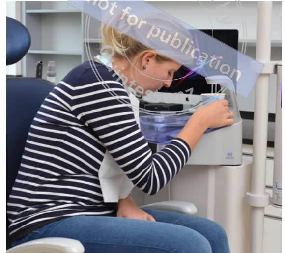
Abb. 21 Bequeme und sichere Spülposition des Patienten.

Nur Patienten unter 100 cm Körpergröße haben eventuell Probleme beim Ausspülen und brauchen dafür Unterstützung. Der Abstand von Sitz zu Speibecken ist schlicht zu hoch.