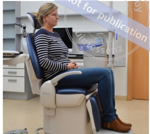
Abb. 19 Entspannte Sitzposition.

Der Patient kann sich wie in einem Lehnstuhl mit Armlehnen setzen. Da für die Füße ein abknickendes Fußteil vorgesehen ist, lässt sich der Patient in dieser Sitzposition beliebig hoch und runter fahren. Die Sitzpolsterung ist dick und bequem.