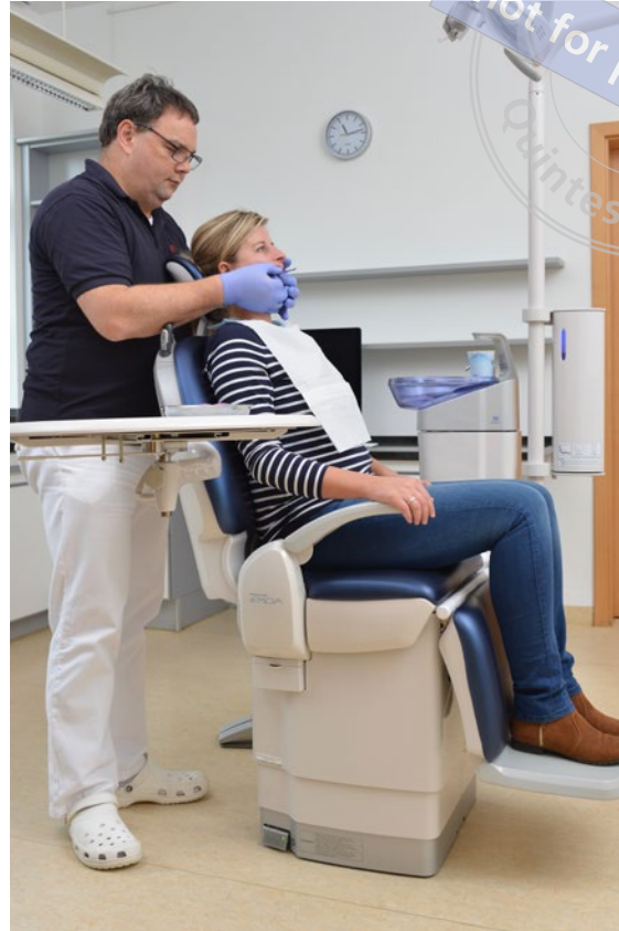
Abb. 11 Abformung des Oberkiefers beim sitzenden Patienten in hochgefahrner Stuhlposition – Patient und Behandler in stabiler und ergonomischer Position.

Die Mehrheit unserer Patienten bevorzugen die sitzende Position bei der Kieferabformung. Hierfür wird der Behandlungsstuhl deutlich nach oben gefahren, um in gerader und entspannter Haltung des Behandlers die Abformung mit korrekter Einschätzung der Kiefermitte sowie der horizontal ausgerichteten Positionierung der Abformlöffel zu erreichen.