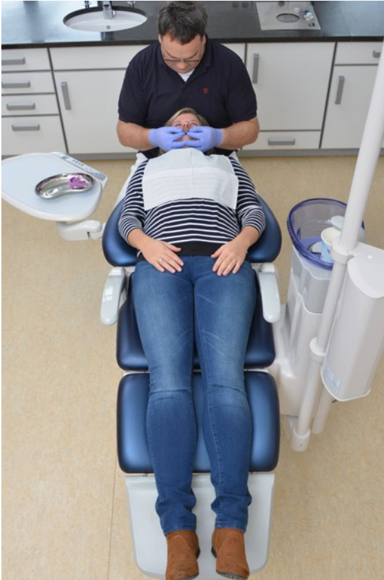
Abb. 10 Abformung am entspannt liegenden Patienten.