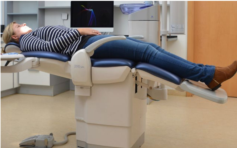
Abb. 20 Durch die vier Achsen (Kopfstütze, Becken, Kniegelenk und Fußstütze) der Behandlungseinheit kommt ein schmerzhaftes Hohlliegen nicht vor. Ein Kissen oder Keil, wie bei anderen Einheiten ist nicht notwendig.